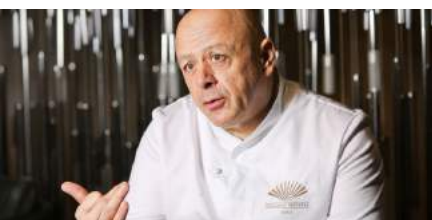
Thierry MARX Chef exécutif Mandarin Oriental Paris Fondateur de Cuisine Mode d'Emploi(s)

"Nombreux sont ici les professionnels qui fournissent, au-delà des manufactures, les signatures renommées de la joaillerie, de la lunetterie ou de la maroquinerie haut de gamme. "