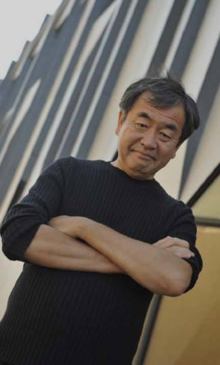
Kengo KUMA Architecte de la Cité des Arts de Besançon

"Ce projet est né de la rencontre entre l'histoire et le bâti, entre l'eau et la lumière, entre la ville et la nature.